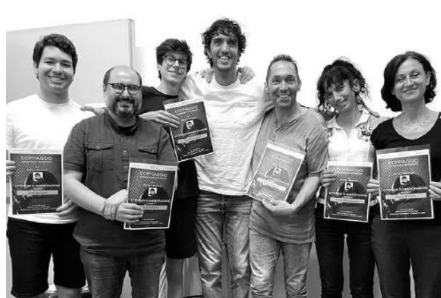
Alcuni allievi del Workshop Intensivo di Doppiaggio.